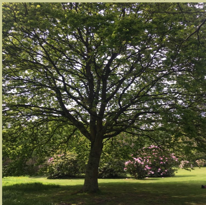
Public placé en demi-cercle